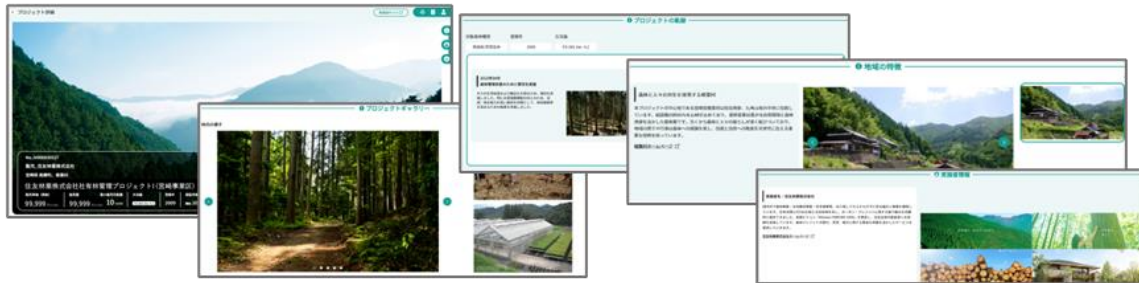
<「森かち」販売ページイメージ>